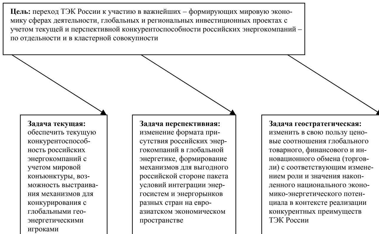
Рис. 1. Императивы формирования стратегических инструментов управления экспортной деятельностью ТЭК России

российских бизнес-структур в высококонкурентной среде мировой экономики [3].